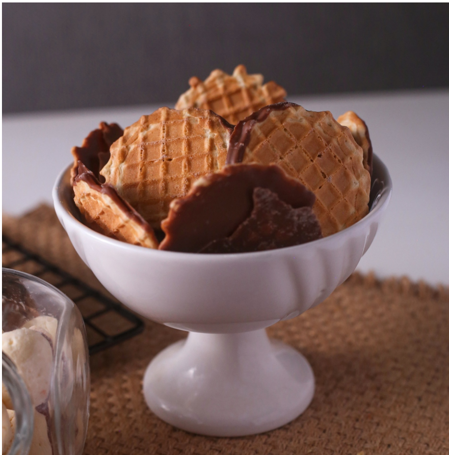
Casquinha - Biscoito crocante com chocolate ao leite

CÓD 222 - Casquinha 130g - R$ 14,50 CÓD 224 - Casquinha 400g - R$ 31,00 CÓD 1363 - Casquinha 1,5kg - R$ 94,00