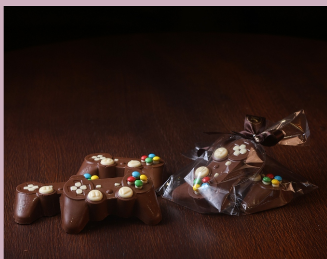
Joystick Chocolate 40g Chocolate ao leite e branco com confeitos CÓD 1429 - R$ 9,50