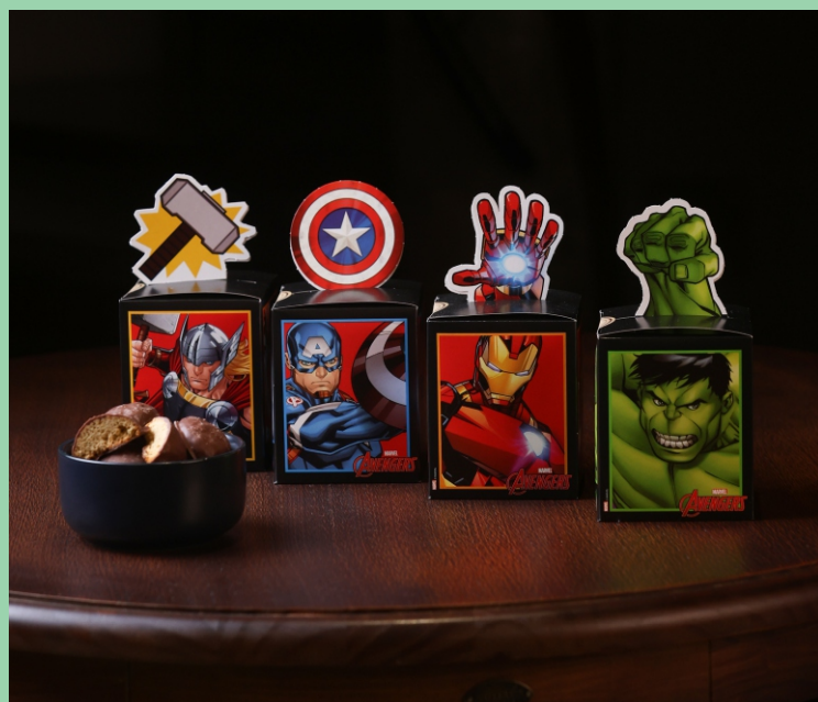
Caixa Personagens 170g Contém Pão de Mel CÓD 1963 - R$ 16,00