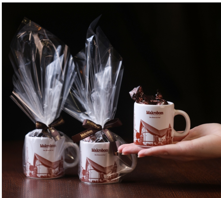
Caneca Makrobom 50g Contém Bombom Crocante Premium CÓD 1425 - R$ 30,00