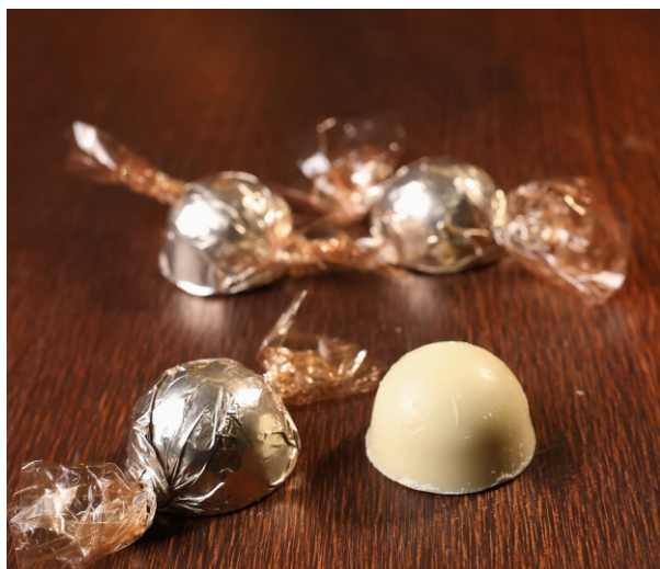
Bombom branco 20g CHOCOLATE BRANCO CÓD 1417 - R$ 4,00