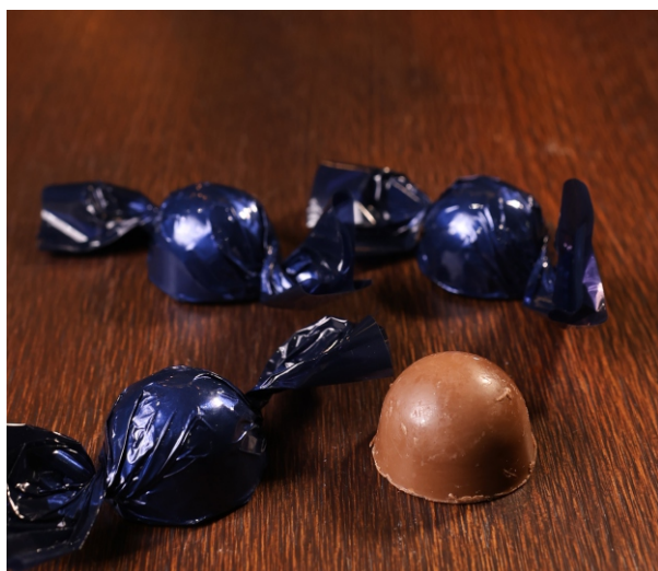
Bombom ao leite 20g CHOCOLATE ZERO AÇÚCAR CÓD 1418 - R$ 5,50