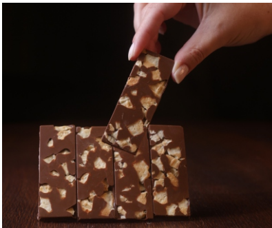
Barras Choco Casquinha 60g Chocolate ao leite com pedaços de casquinha CÓD 1849 - R$ 9,75