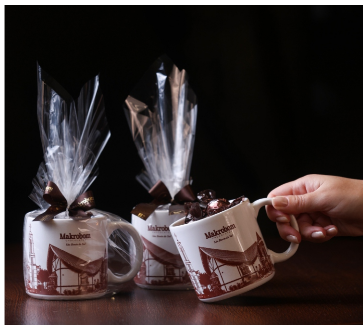
Caneca Makrobom 100g Contém Bombom Crocante Premium CÓD 1426 - R$ 42,00