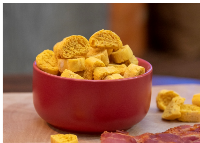
Torradinha SALGADA sabor bacon

CÓD 1713 - Biscoito de Caramelo Salgado 130g - R$ 7,00