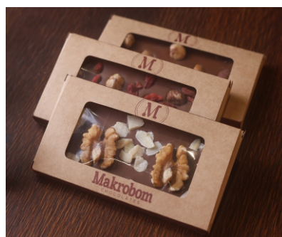
Barra Nuts 35g Chocolate ao leite com amêndoa, avelã, nozes, castanhas e goji berry CÓD 1410 - R$ 8,50