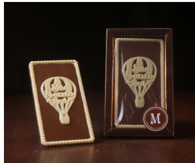
Barra Balão São Bento do Sul 40g Chocolate ao leite e branco CÓD 1613 - R$ 15,50