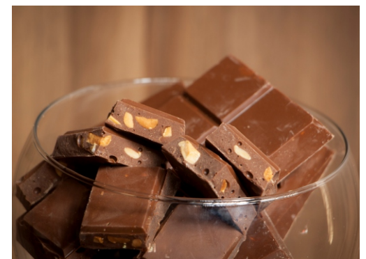
Barra de chocolate ao leite com amendoim torrado

CÓD 11 - Licorzinho 100g - R$ 10,50 CÓD 13 - Licorzinho 500g - R$ 35,00