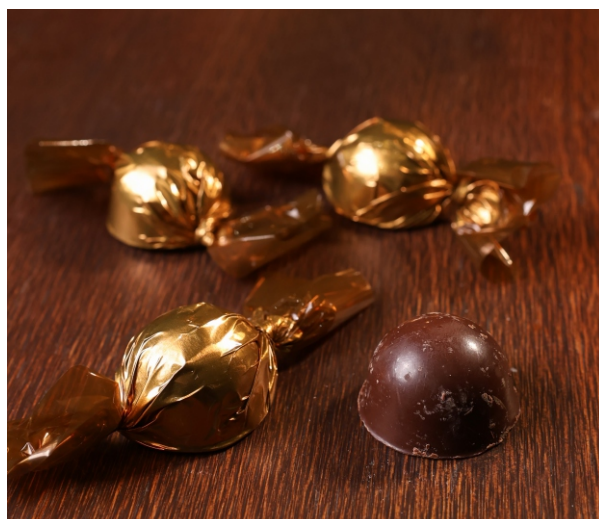
Bombom meio amargo 20g CHOCOLATE MEIO AMARGO 50% CACAU CÓD 1415 - R$ 3,75