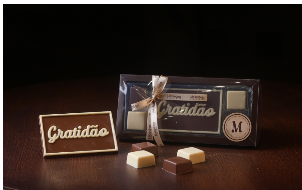
Caixa Chocolate 115g GRATIDÃO Chocolate ao leite e chocolate branco CÓD 1964 - R$ 35,00