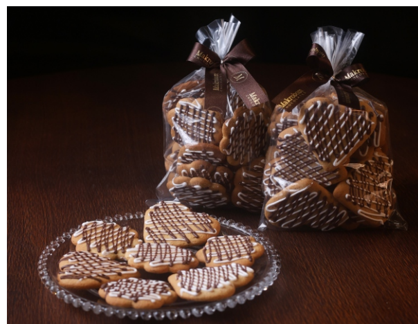
Bolacha Mel e Gengibre 150g Bolacha feita com mel e gengibre e decorada com chocolate CÓD 1393 - R$ 24,00