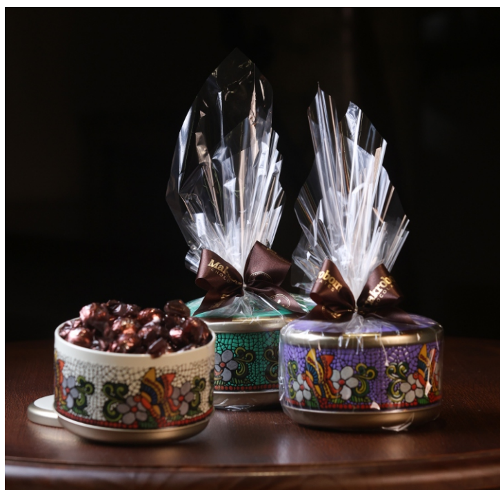
Lata Chocolate 360g Contém Bombom Crocante Premium CÓD 1439 - R$ 78,00