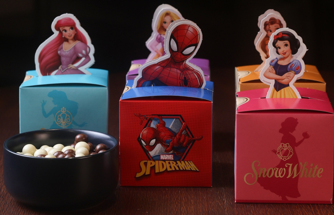
Caixa Personagens 150g Contém drageas de cereal ao leite e branco CÓD 1962 - R$ 18,00