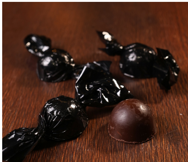
Bombom amargo 20g CHOCOLATE AMARGO 70% CACAU CÓD 1416 - R$ 4,50