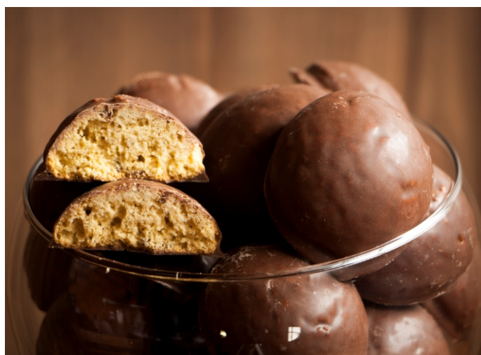
Pão de Mel - Biscoito sabor mel e especiarias com cobertura de chocolate ao leite BISCOITO MACIO

CÓD 6 - Beijo Bom 400g - R$ 14,00 CÓD 1391 - Beijo Bom 1,7kg - R$ 52,00 CÓD 7 - Beijo Bom 4kg - R$ 105,00