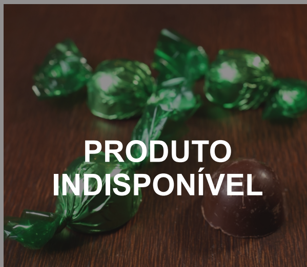
Bombom Zero Lactose 20g CHOCOLATE ZERO LACTOSE CÓD 1419 - R$ 6,25