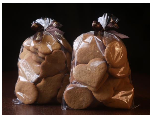
Bolacha de Melado SEM COBERTURA 300g Bolacha feita de melado de cana com especiarias CÓD 1741 - R$ 32,00