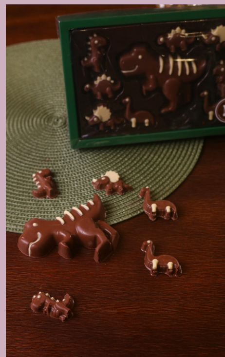
Caixa Dinos 140g Chocolate ao leite e branco CÓD 1754 - R$ 35,00