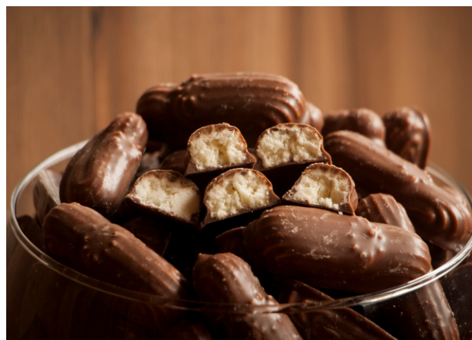
Biscoito sabor Coco

CÓD 113 - Romeu e Julieta 170g - R$ 9,75