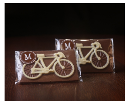
Barra Bike 40g Chocolate ao leite e branco CÓD 1409 - R$ 9,00