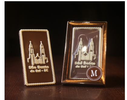
Barra Igreja Matriz São Bento do Sul 40g Chocolate ao leite e branco CÓD 1614 - R$ 15,50