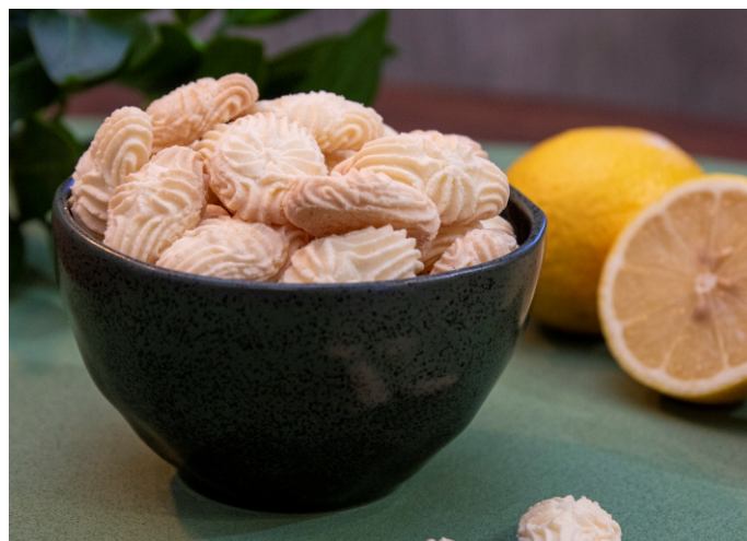
Biscoito sabor limão siciliano

CÓD 1712 - Biscoito de Amendoim 150g - R$ 7,00 CÓD 1823 - Biscoito de Amendoim 400g - R$ 14,00