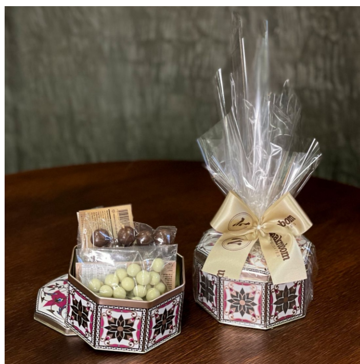
Lata Chocolate 160g Contém drágeas de bananinha ao leite e cereal chocolate branco CÓD 1932 - R$ 52,00