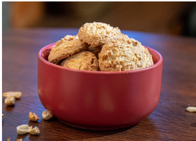
Biscoito com pedaços de amendoim

Biscoitos LEVES e SABOROSOS que DERRETEM na boca !