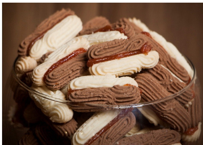
Biscoito sabor coco e chocolate suíço com goiabada

CÓD 1711 - Torradinha Bacon 70g - R$ 7,00