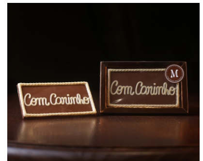
Barra Com Carinho 40g Chocolate ao leite e branco CÓD 1696 - R$ 12,75