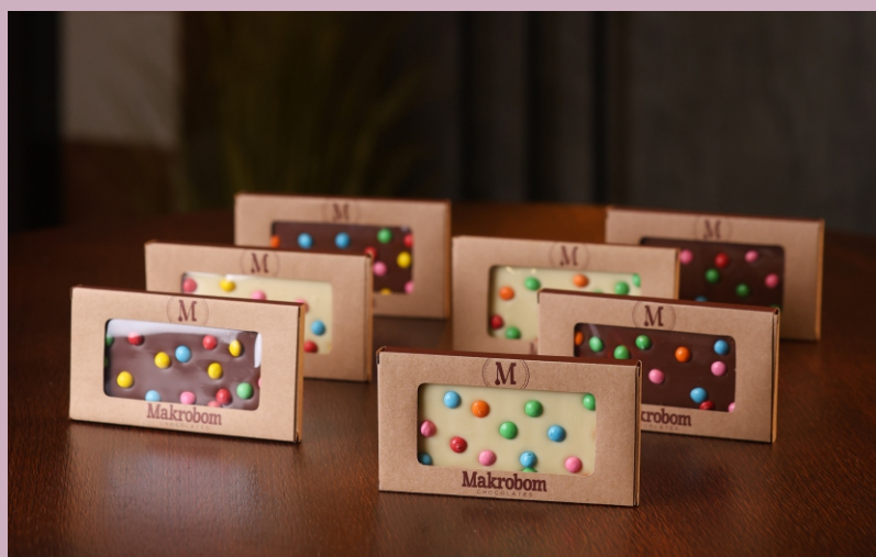
Barra Kids 35g Chocolate ao leite ou branco com confeitos coloridos CÓD 1411 - R$ 8,50