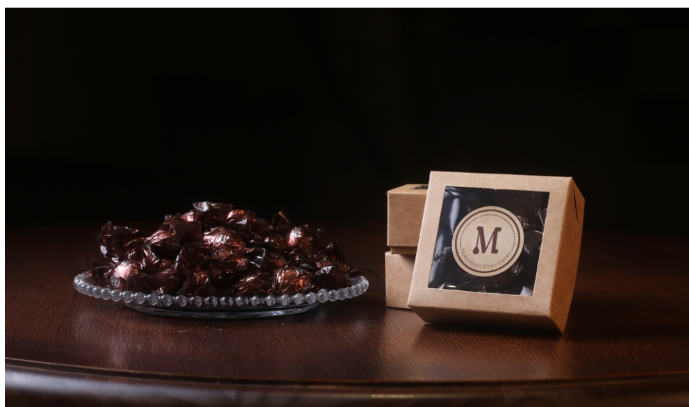
Caixa Chocolate 80g Contém Bombom Crocante Premium CÓD 1421 - R$ 13,00