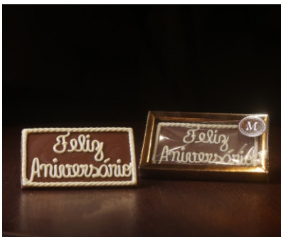
Barra Feliz Aniversário 40g Chocolate ao leite e branco CÓD 1616 - R$ 12,75