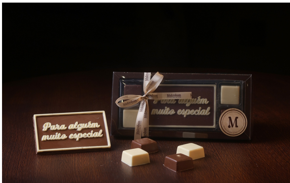
Caixa Chocolate 115g PARA ALGUÉM MUITO ESPECIAL Chocolate ao leite e chocolate branco CÓD 1964 - R$ 35,00