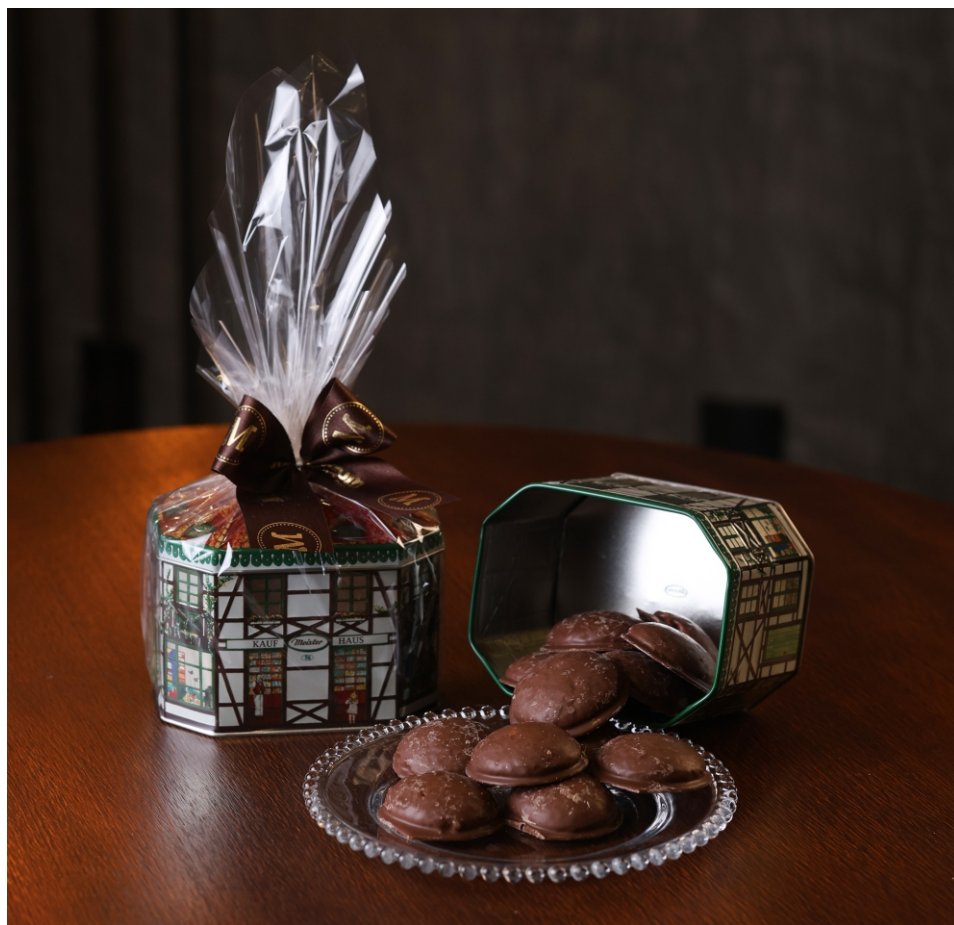
Lata Biscoito 220g Contém Beijo Bom - Biscoito de melado de cana com cobertura de chocolate ao leite - CROCANTE CÓD 1838 - R$ 48,00