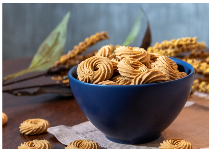
Biscoito sabor caramelo salgado

CÓD 1714 - Biscoito de Limão Siciliano 130g - R$ 7,00 CÓD 1824 - Biscoito de Limão Siciliano 300g - R$ 12,00