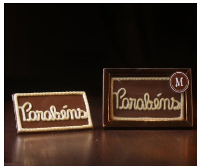
Barra Parabéns 40g Chocolate ao leite e branco CÓD 1695 - R$ 12,75