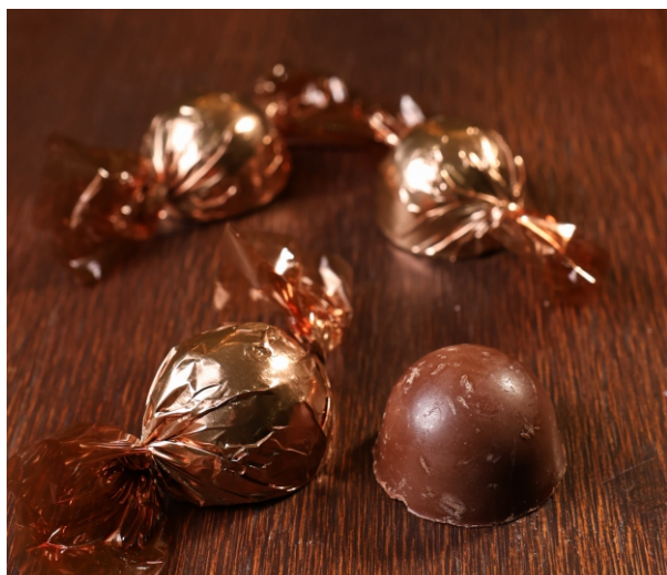
Bombom ao leite 20g CHOCOLATE AO LEITE 30% CACAU CÓD 1414 - R$ 3,50