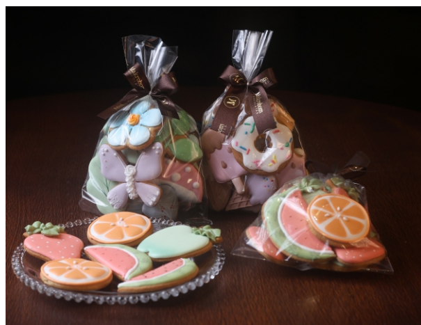
Bolacha de Melado 150g Bolacha feita de melado de cana com especiarias e decorada com glacê CÓD 425 - R$ 34,00