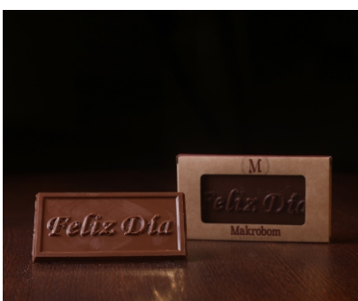
Barra Chocolate Feliz Dia 30g Chocolate ao leite CÓD 1407 - R$ 7,50