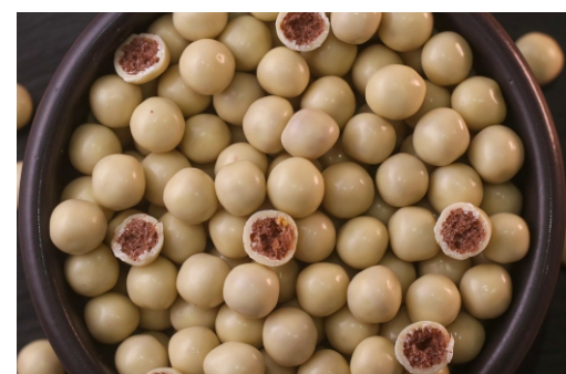
Drágeas Chocolate Branco

CÓD 1787 - Amendoim Branco 500g - R$ 49,00