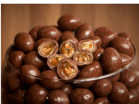
Drágea de amendoim caramelizado com chocolate ao leite

CÓD 18 - Castanha do Pará 500g - R$ 60,00