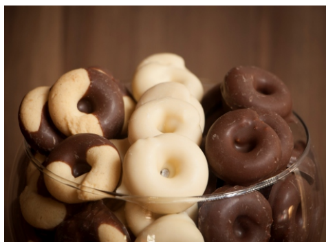
Bambolê - Biscoito sabor leite condensado com cobertura de chocolate