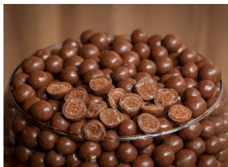
Drágea de cereal com chocolate ao leite

CÓD 22 - Bombom Crocante 500g - R$ 42,00