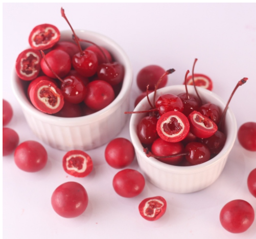
Drágea Gourmet Cereja Cereja glaceada com chocolate branco saborizado

CÓD 1400 - Drágea Cereja 150g - R$ 22,00