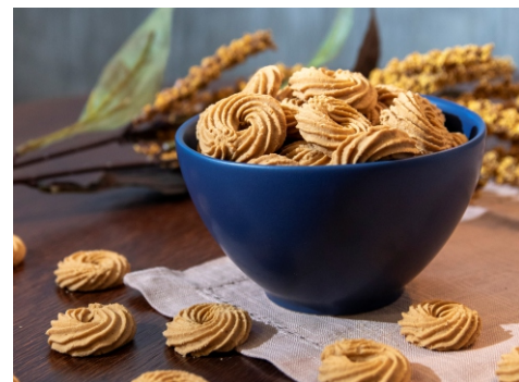
Biscoito sabor caramelo salgado