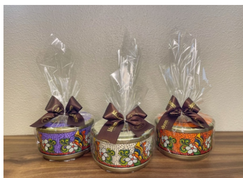
Lata Chocolate 360g Contém Bombom Crocante Premium CÓD 1439 - R$ 75,00