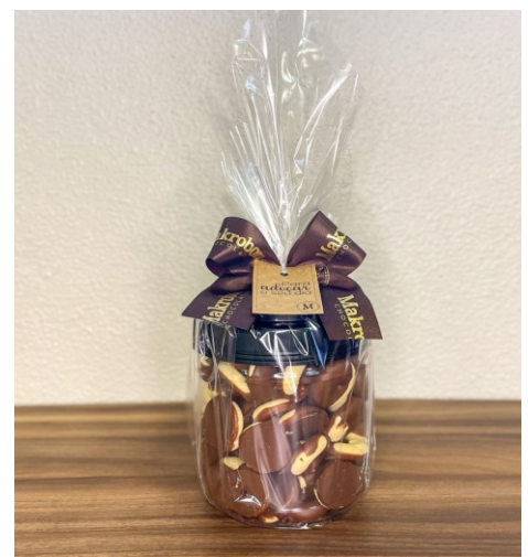
Pote Biscoito 400g Contém Bambolê Meio a Meio CÓD 1456 - R$ 30,00