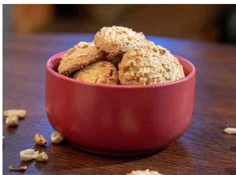
Biscoito com pedaços de amendoim