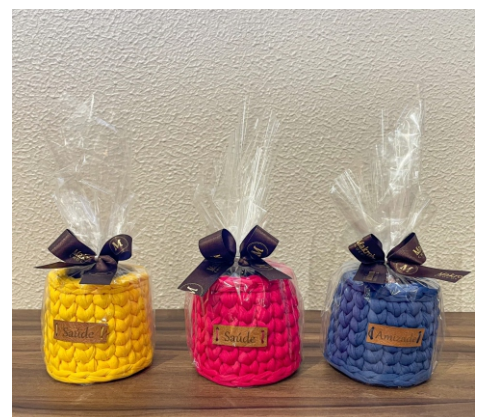
Mini Cachepot 60g Contém Bombom Crocante Premium CÓD 1431 - R$ 25,00 *PRODUTO ARTESANAL - FEITO A MÃO **Cores do fio podem variar conforme estoque