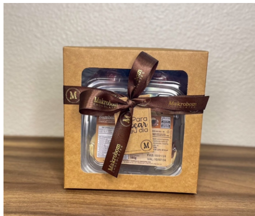
Caixa Presente 260g Contém biscoito e bombons ao leite CÓD 1422 - R$ 32,00 *Biscoitos podem variar conforme estoque