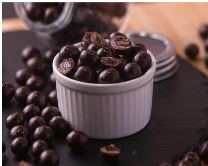
Uva Passa com chocolate 70% Cacau

CÓD 1390 - Bananinha 70% 150g - R$ 26,50 CÓD 414 - Bananinha 70% 500g - R$ 82,00