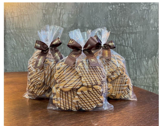
Bolacha Mel e Gengibre 150g Bolacha feita com mel e gengibre e decorada com chocolate CÓD 1393 - R$ 19,50