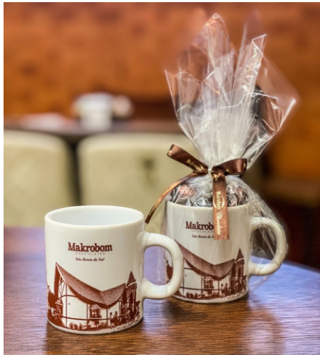
Caneca Makrobom 50g Contém Bombom Crocante Premium CÓD 1425 - R$ 28,50