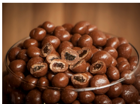
Drágea de uva passa com chocolate ao leite

CÓD 30 - Flocos de Cereais 500g - R$ 40,00