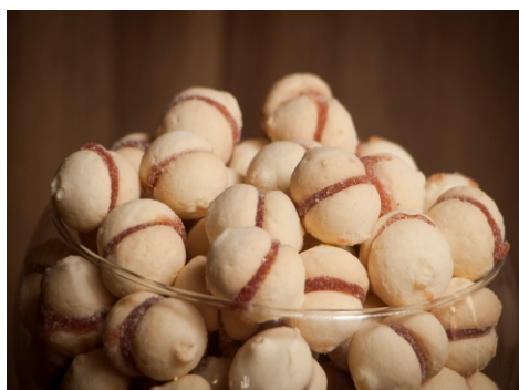
Beijinho - Biscoito sabor nata com recheio de goiabada