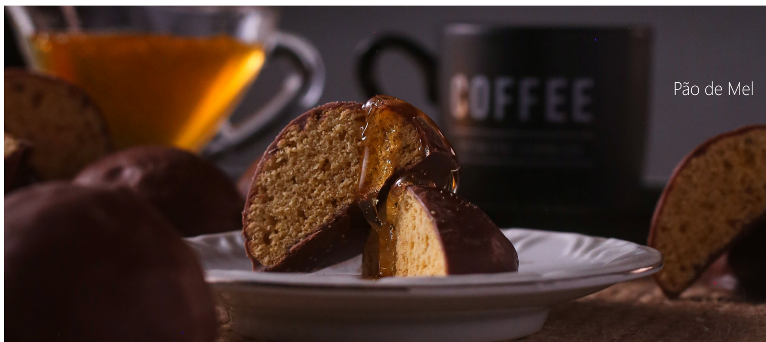
Pão de Mel

CÓD 1 - Pão de Mel 130g - R$ 5,75 CÓD 3 - Pão de Mel 400g - R$ 13,00 CÓD 1403 - Pão de Mel 1,7kg - R$ 48,00 CÓD 4 - Pão de Mel 4kg - R$ 98,00