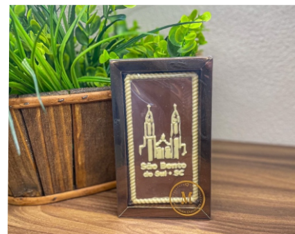
Barra Igreja Matriz São Bento do Sul 40g Chocolate ao leite e branco CÓD 1614 - R$ 15,00