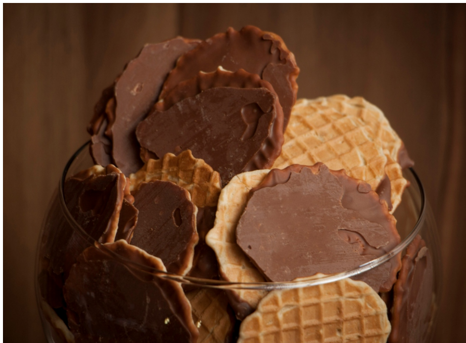
Casquinha - Biscoito crocante com chocolate ao leite