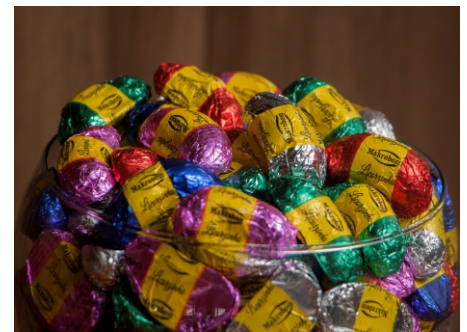
Licorzinho - Confeitos de licor com cobertura ao leite