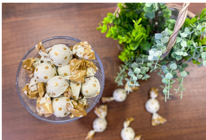
Bombom branco 20g CHOCOLATE BRANCO CÓD 1417 - R$ 3,50