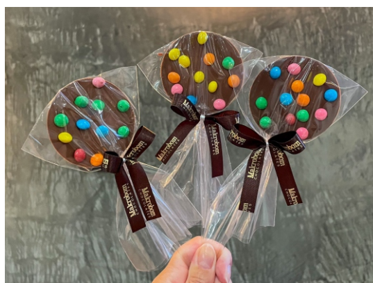
Pirulito 30g Chocolate ao leite com confeitos coloridos CÓD 1455 - R$ 8,50