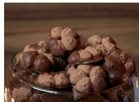
Flor de Cacau - Biscoito sabor cacau com cobertura de chocolate