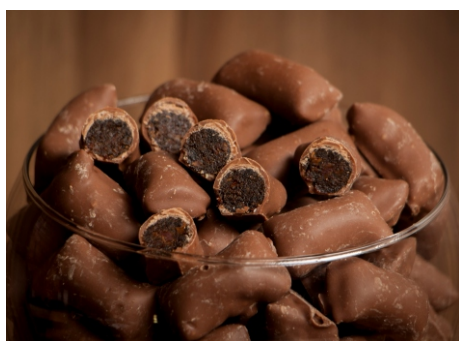
Bala de banana - Banana passa com cobertura de chocolate ao leite CÓD 39 - Bala de Banana 500g - R$ 38,00