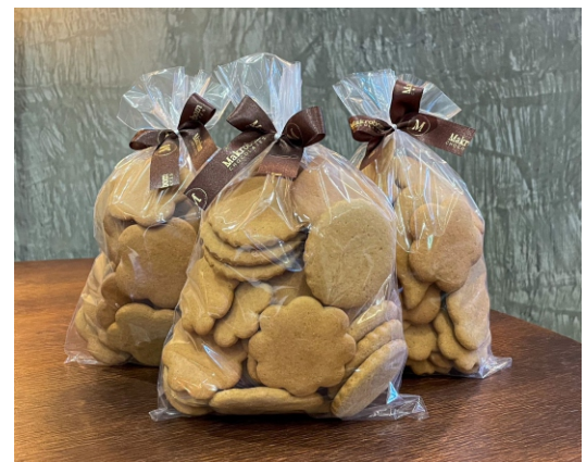
Bolacha de Melado SEM COBERTURA 300g Bolacha feita de melado de cana com especiarias CÓD 1741 - R$ 28,00