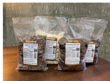
Chocolates e Coberturas em pedaços

CÓD 1395 - Chocolate ao leite 500g - R$ 34,00 CÓD 1396 - Chocolate Meio Amargo 500g - R$ 36,00 CÓD 139 - Cobertura Frac. branco 500g - R$ 16,00 CÓD 138 - Cobertura Frac. ao leite 500g - R$ 16,00