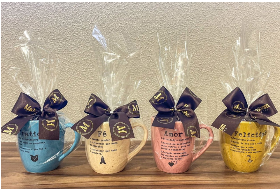
Caneca Presente 110g Contém Bombom Crocante Premium CÓD 1427 - R$ 41,50 *Cores: Azul, Bege, Rosa e Amarelo