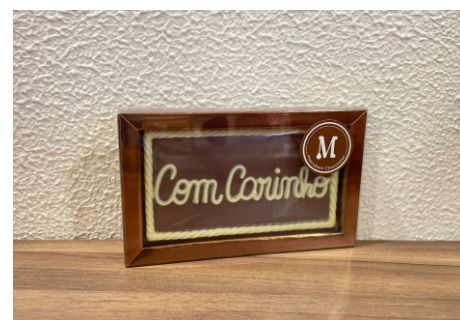
Barra Com Carinho 40g Chocolate ao leite e branco CÓD 1696 - R$ 12,50