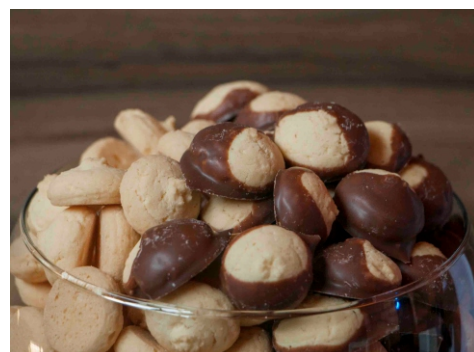
Pingo de Leite Condensado - Biscoito sabor leite condensado