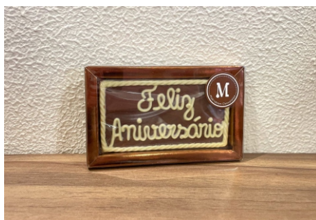
Barra Feliz Aniversário 40g Chocolate ao leite e branco CÓD 1616 - R$ 12,50