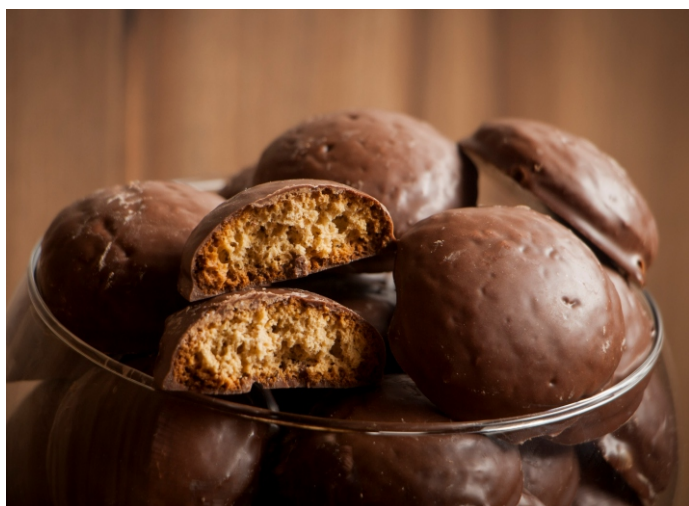
Beijo Bom - Biscoito de melado de cana com cobertura sabor chocolate ao leite BISCOITO CROCANTE

CÓD 6 - Beijo Bom 400g - R$ 13,00 CÓD 1391 - Beijo Bom 1,7kg - R$ 48,00 CÓD 7 - Beijo Bom 4kg - R$ 98,00