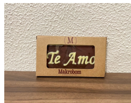
Barra Chocolate Te amo 35g Chocolate ao leite e branco CÓD 1408 - R$ 8,00