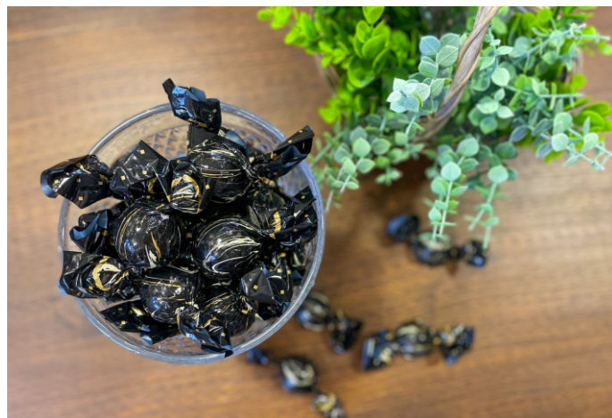
Bombom amargo 20g CHOCOLATE AMARGO 70% CACAU CÓD 1416 - R$ 4,00