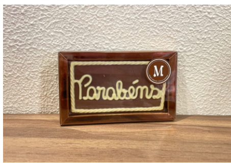
Barra Parabéns 40g Chocolate ao leite e branco CÓD 1695 - R$ 12,50