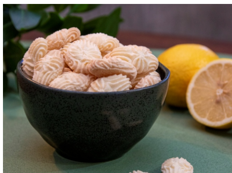
Biscoito sabor limão siciliano