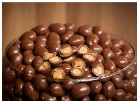
Drágea de amendoim torrado com chocolate ao leite