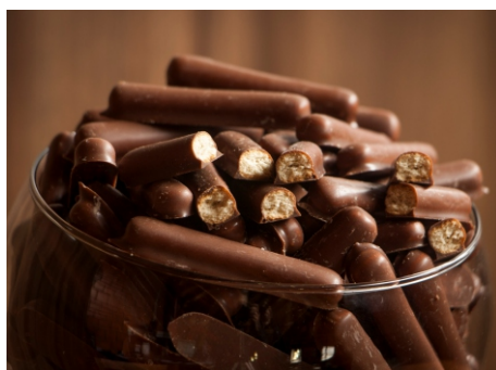
Palito Doce - Biscoito doce com cobertura sabor chocolate ao leite CÓD 394 - Palito Doce 80g - R$ 6,75 CÓD 382 - Palito Doce 500g - R$ 22,00