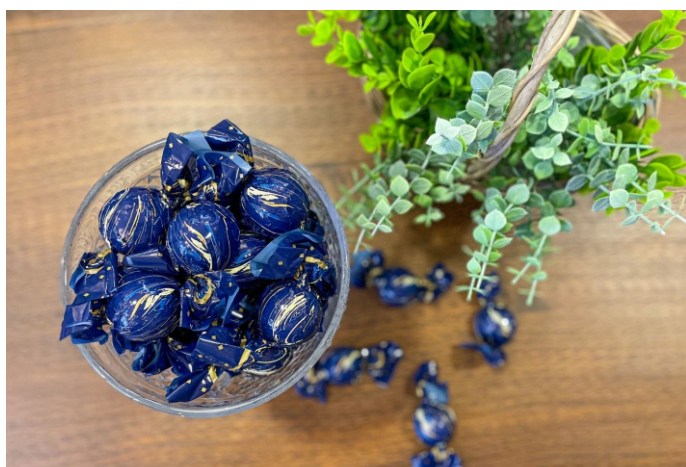
Bombom ao leite 20g CHOCOLATE ZERO AÇÚCAR CÓD 1418 - R$ 5,00