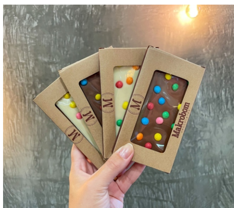
Barra Kids 35g Chocolate ao leite ou branco com confeitos coloridos CÓD 1411 - R$ 8,00