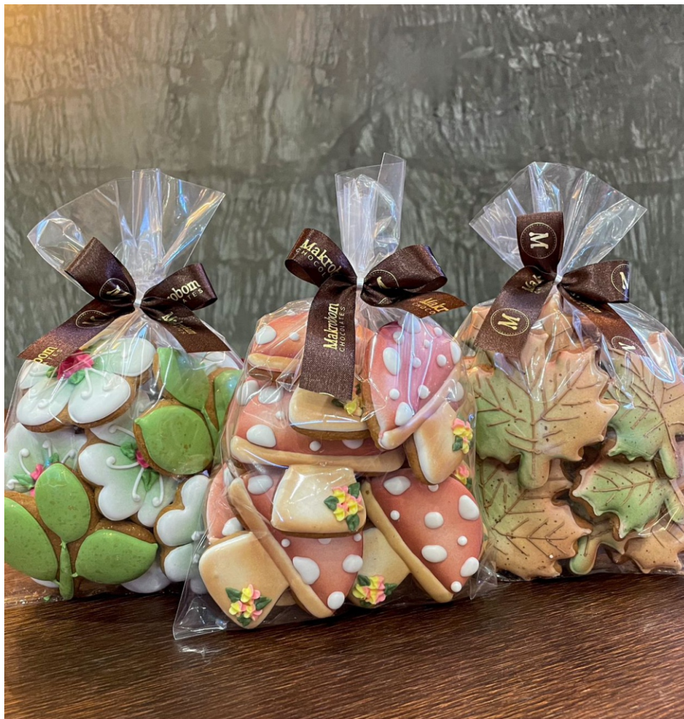
Bolacha de Melado 150g Bolacha feita de melado de cana com especiarias e decorada com glacê CÓD 425 - R$ 29,50