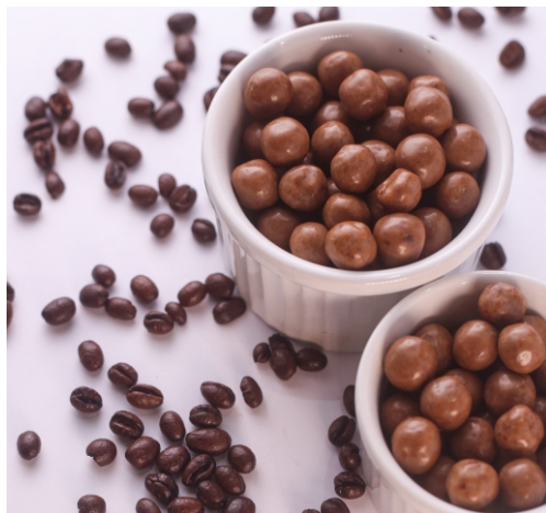
Drágea Gourmet Cereal com Café Cereal sabor chocolate com chocolate branco saborizado

CÓD 1400 - Drágea Cereja 150g - R$ 22,00