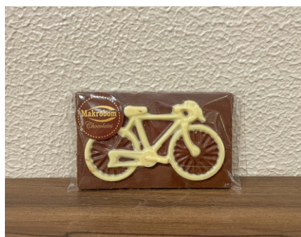
Barra Bike 40g Chocolate ao leite e branco CÓD 1409 - R$ 8,50