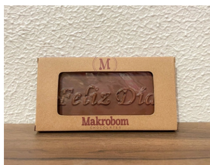
Barra Chocolate Feliz Dia 30g Chocolate ao leite CÓD 1407 - R$ 7,00