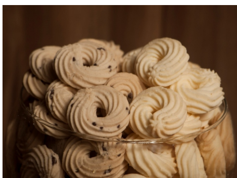
Rosca Nata - Biscoito sabor nata