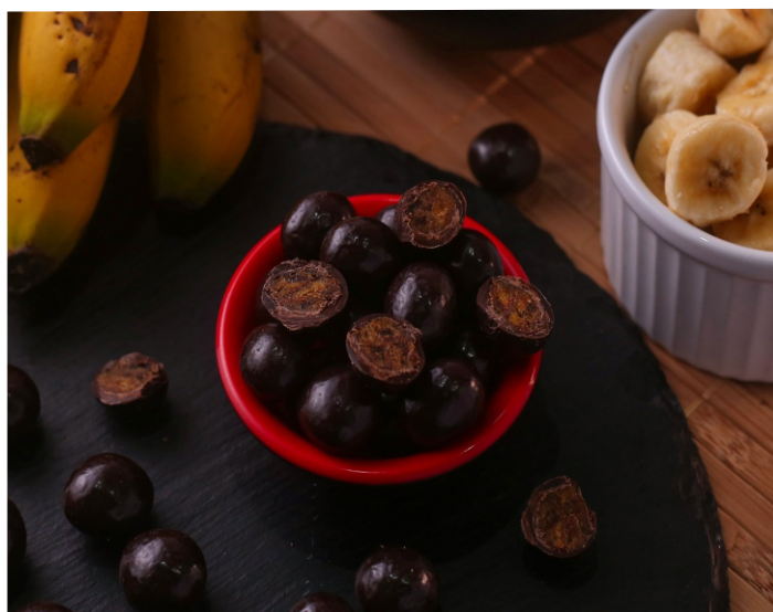
Banana passa com chocolate 70% Cacau

CÓD 1390 - Bananinha 70% 150g - R$ 26,50 CÓD 414 - Bananinha 70% 500g - R$ 82,00