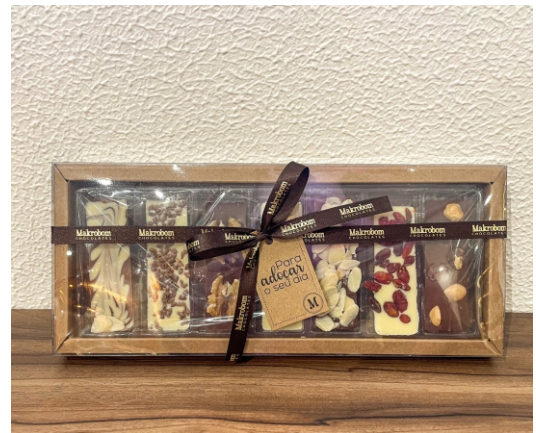
Caixa Mix Barras 185g Mini barras de chocolate ao leite e branco com nozes, castanhas e frutas secas CÓD 1424 - R$ 35,00