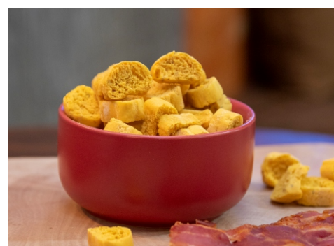
Torradinha SALGADA - Massa de pão crocante sabor bacon