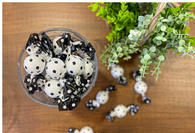
Bombom meio amargo 20g CHOCOLATE MEIO AMARGO 50% CACAU CÓD 1415 - R$ 3,25