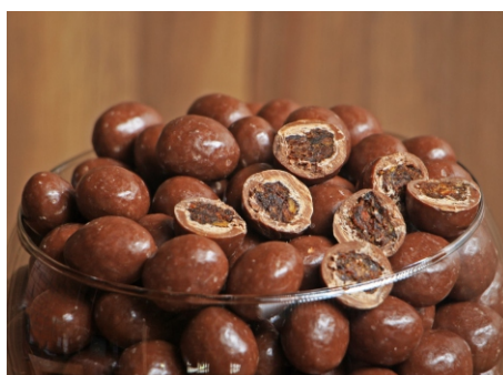
Drágea de banana passa com chocolate ao leite