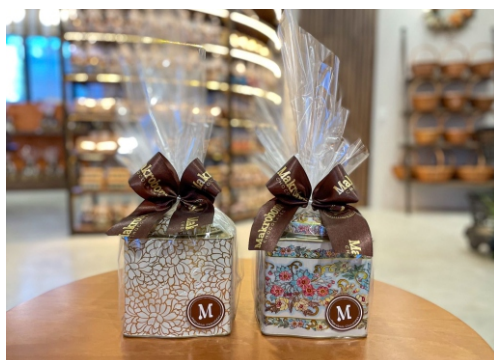
Lata Biscoito 120g Contém Biscoito Rosca Nata CÓD 1694 - R$ 39,00