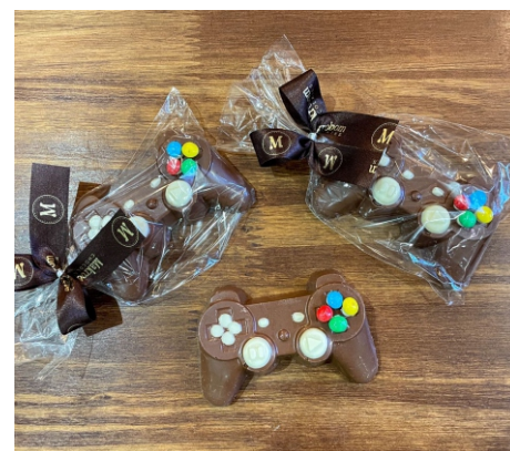
Joystick Chocolate 40g Chocolate ao leite e branco com confeitos CÓD 1429 - R$ 9,00