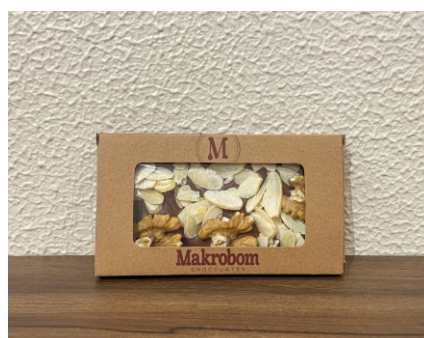
Barra Nuts 35g Chocolate ao leite com nozes, castanhas e frutas secas CÓD 1410 - R$ 8,00