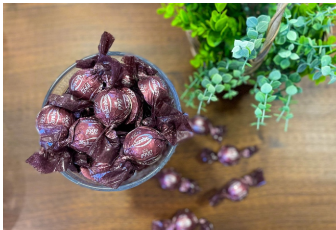
Bombom ao leite 20g CHOCOLATE AO LEITE 30% CACAU CÓD 1414 - R$ 3,00