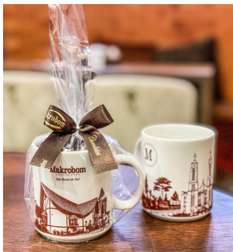
Caneca Makrobom 100g Contém Bombom Crocante Premium CÓD 1426 - R$ 39,75