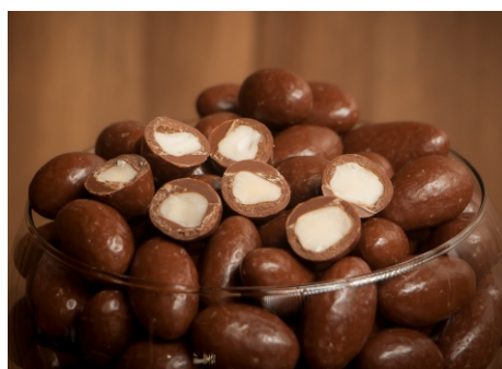
Drágea de castanha do Pará com chocolate ao leite

CÓD 17 - Castanha do Pará 100g - R$ 14,00