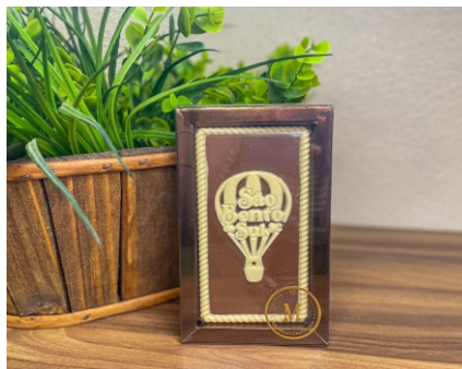
Barra Balão São Bento do Sul 40g Chocolate ao leite e branco CÓD 1613 - R$ 15,00