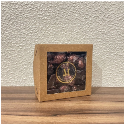
Caixa Chocolate 80g Contém Bombom Crocante Premium CÓD 1421 - R$ 12,50