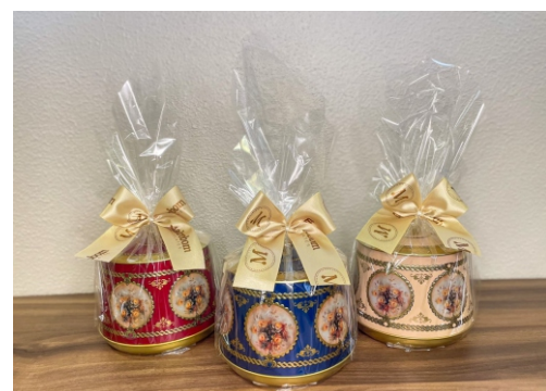
Lata Chocolate 400g Contém Bombom Crocante Premium CÓD 1440 - R$ 85,00