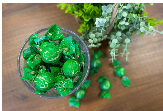
Bombom Zero Lactose 20g CHOCOLATE ZERO LACTOSE CÓD 1419 - R$ 5,00