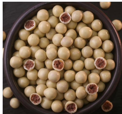
Drágea Cereal Branco Cereal sabor chocolate com chocolate branco

CÓD 1402 - Flocos Branco 150g - R$ 12,00 CÓD 1366 - Flocos Branco 500g - R$ 36,00