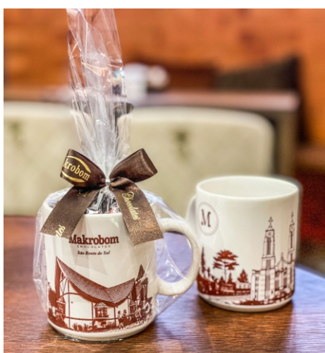
Caneca Makrobom 100g Contém Bombom Crocante Premium CÓD 1426 - R$ 39,75