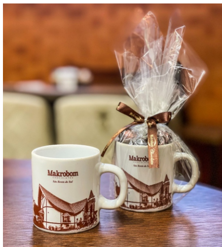
Caneca Makrobom 50g Contém Bombom Crocante Premium CÓD 1425 - R$ 28,50