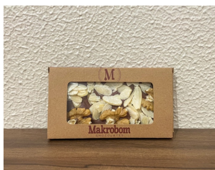
Barra Nuts 35g Chocolate ao leite com nozes, castanhas e frutas secas CÓD 1410 - R$ 8,00