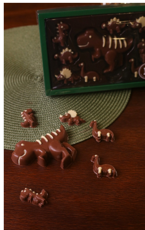
Caixa Dinos 140g Chocolate ao leite e branco CÓD 1754 - R$ 32,00