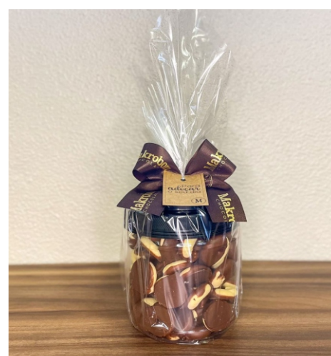
Pote Biscoito 400g Contém Bambolê Meio a Meio CÓD 1456 - R$ 30,00